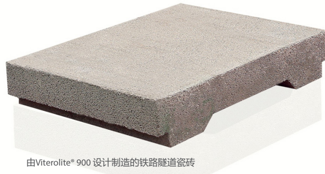
由Viterolite® 900 设计制造的铁路隧道瓷砖